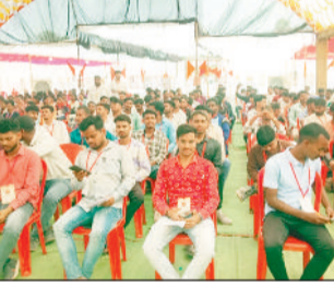
कई दिनों से लगातार चल रही थी। प्रातः 8 बजे से प्रांभ हुए पंजीयन में लगभग 500 से अधिक युवाओं ने अपना पंजीयन कराया। युवक युवतियों

कोसीर। बीते 1 फरवरी को सारंगढ़ स्थित पं. लोचन प्रसाद शासकीय महाविद्यालय में संघ शताब्दी वर्ष के उपलक्ष्य में युवाओं के मन में देश भक्ति की भावना जागृति को लेकर युवा संगम का आयोजन किया गया था। जिसमें 5 सौ से अधिक युवाओं ने हिस्सा लिया। उक्त आयोजन में गांव गांव से युवक युवतियों ने हिस्सा लिया। युवा संगम में युवाओं ने अपनी जिज्ञासा भी सभी के बीच रखी जिसका जवाब समिति सदस्यों व संघ पदाधिकारियों के द्वारा प्रदान किया गया और उनकी जिज्ञासा को समाप्त किया गया। युवा संगम कार्यक्रम की तैयारी बीते